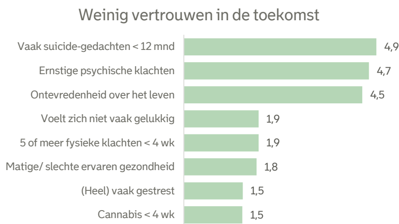
Figuur 1 Relatieve kans op uitkomst bij jongeren met weinig vertrouwen in hun toekomst (2022)

Gecorrigeerd voor achtergrondkenmerken: geslacht, leeftijd, opleidingsniveau, migratieachtergrond